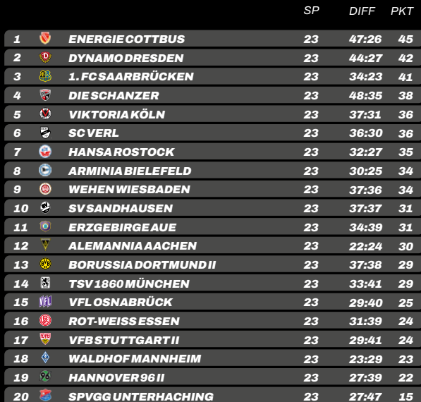
TABELLE & TORJÄGER