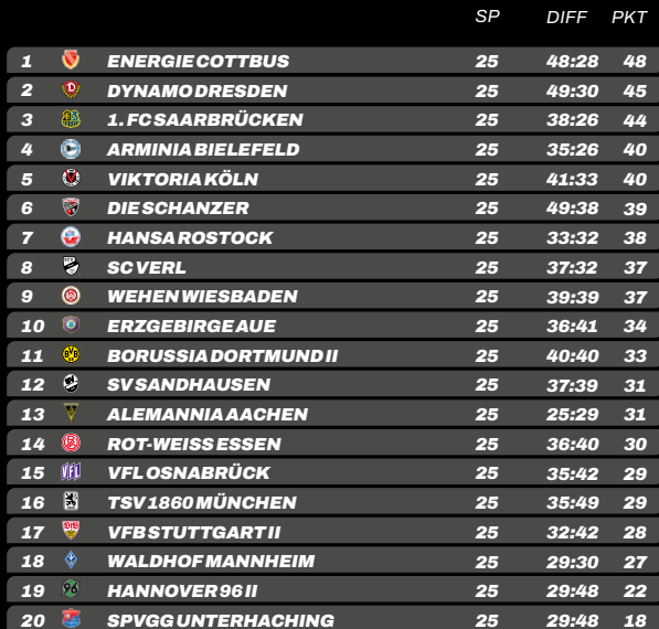
TABELLE & TORJÄGER