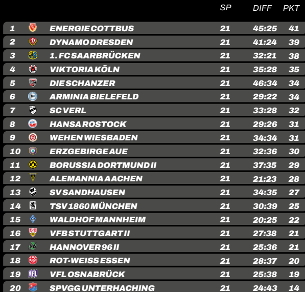
TABELLE & TORJÄGER