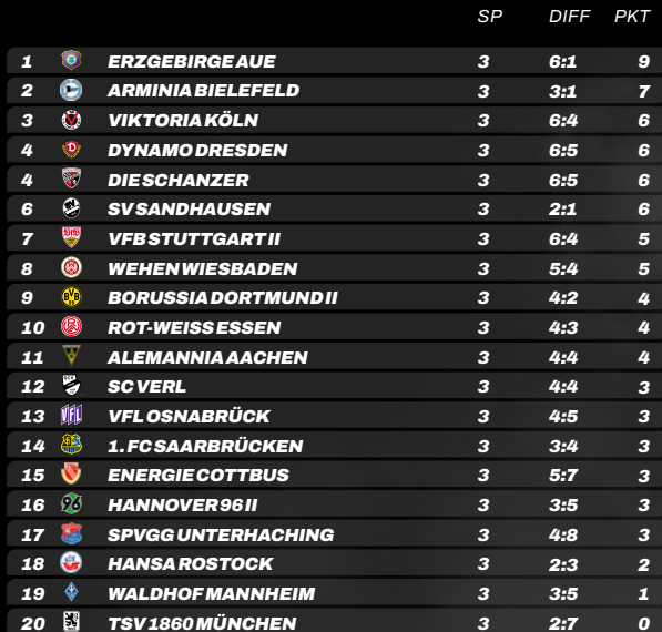
TABELLE & TORJÄGER