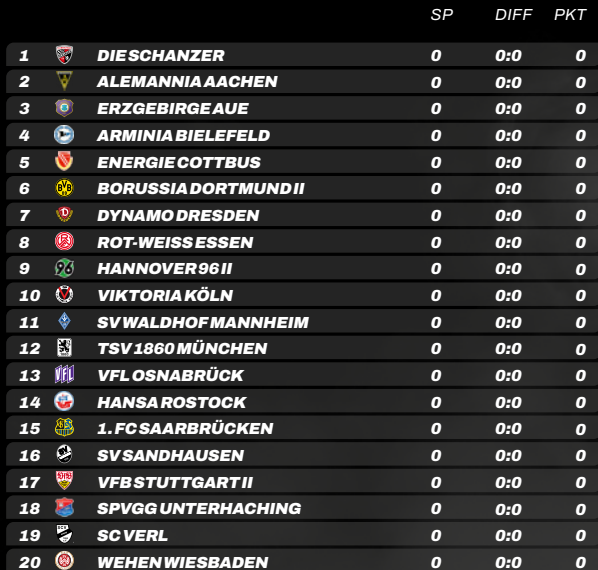
TABELLE & TORJÄGER